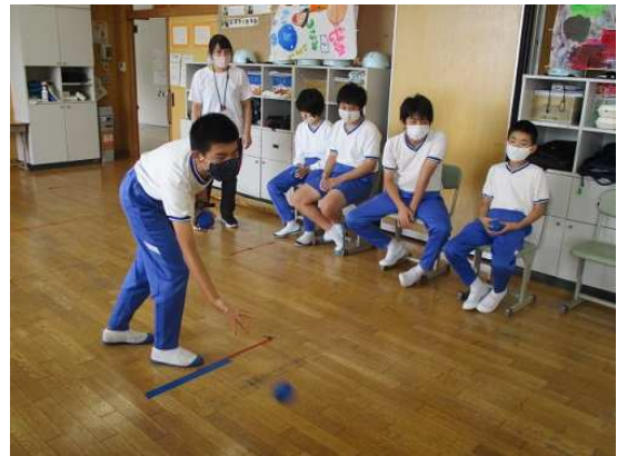
中学部 障害者スポーツ体験