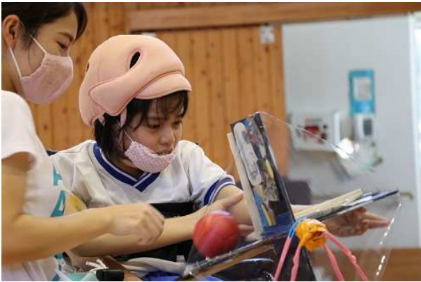
小学部 自立グループ運動会