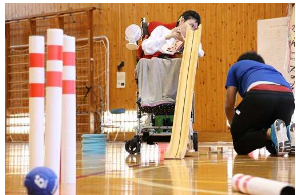
高等部 自立グループ運動会