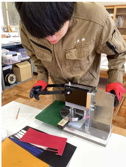
ものづくり課での作業