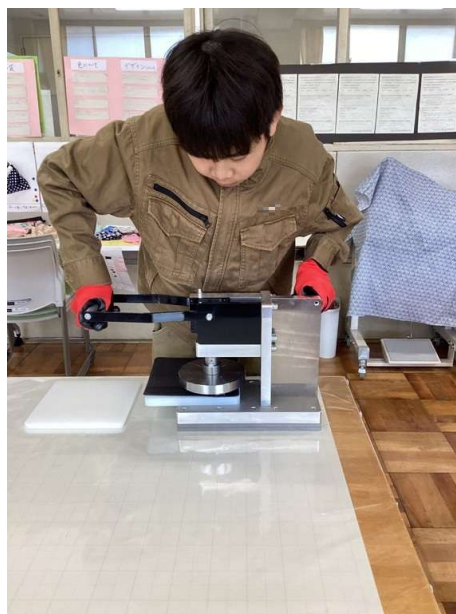
ハンドプレス機での型抜き作業